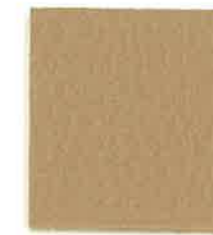
•Dune 013 32 023