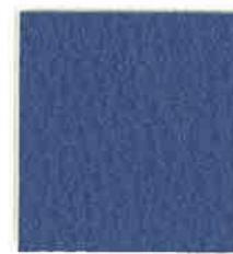
•Lavande 013 32 009