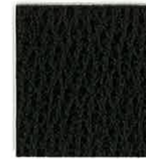
•Anthracite 013 32 002