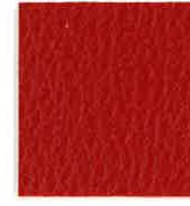
•Groseille 013 32 026