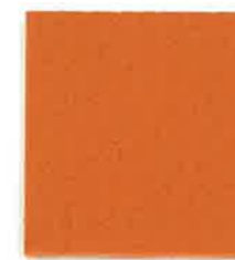
•Citrouille 013 32 015