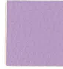
•Lilas 013 32 008