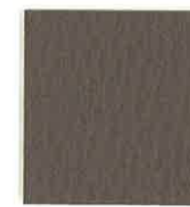
•Taupe 013 32 043