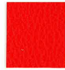
•Tomate 013 32 044