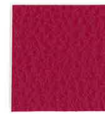
•Begonia 013 32 046