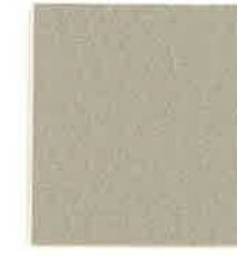
•Mastic 013 32 013