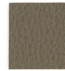
•Terre 013 32 048