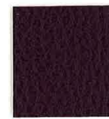
•Myrtille 013 32 045