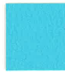
•Turquoise 013 32 047