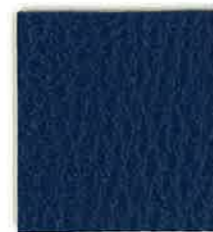
•Nuit 013 32 011