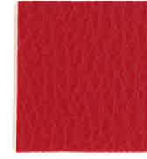
•Pivoine 013 32 025