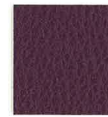
•Quetsche 013 32 007