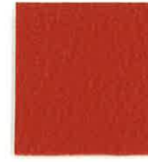
•Tomette 013 32 014