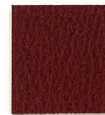
•Morgon 013 32 016

Lire impérativement les conseils d'entretien / Asegúrese de leer las instrucciones de mantenimiento