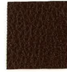
•Café 013 32 049