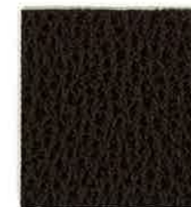
•Chocolat 013 32 001